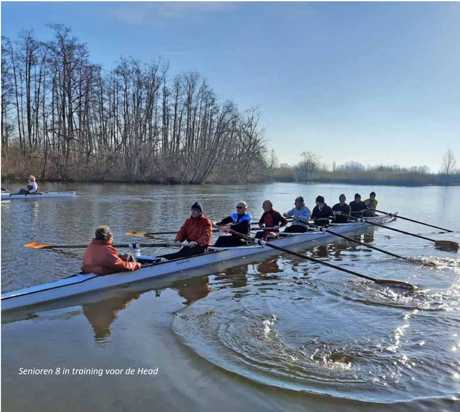
Senioren 8 in training voor de Head